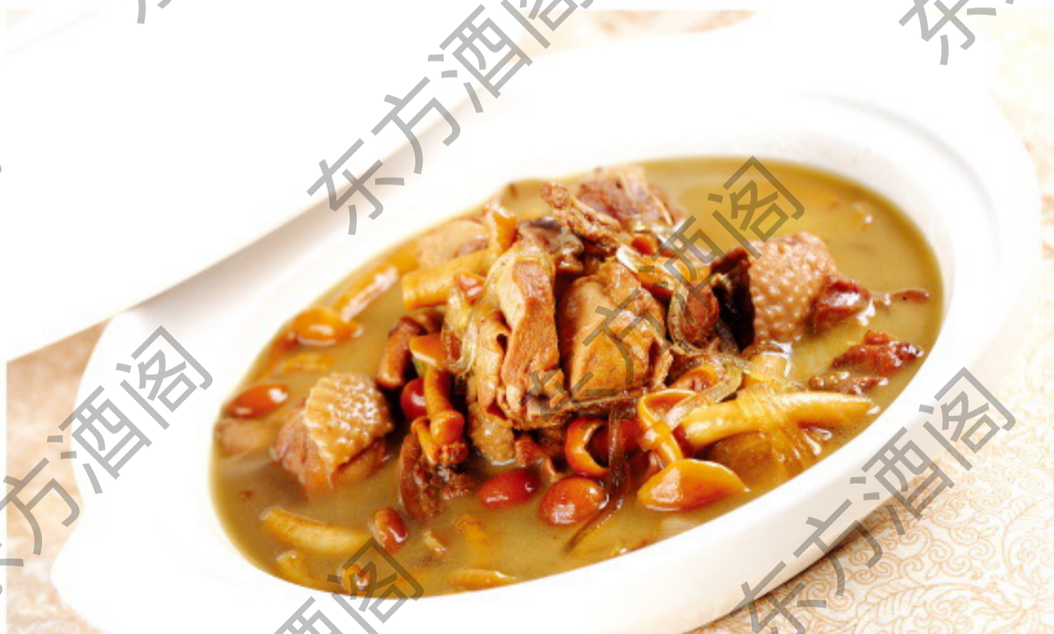
8082 银锅笨鸡滑仔菇 Котелок с супом из домашней курицы с грибами Рубль 1680