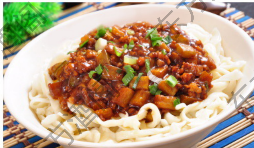
B117 手擀面 (茄子肉丝面/ 尖椒茄子面/炸酱面)

Домашняя лапша (с баклажанами и мясом, с зеленым перцем, с фасолевым соусом и яйцом) Рубль 780