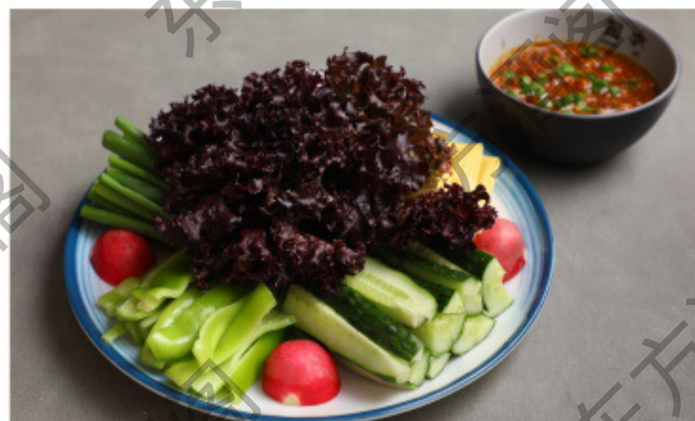
A018 大丰收 Салат со свежими овощами в соусе Рубль 1080