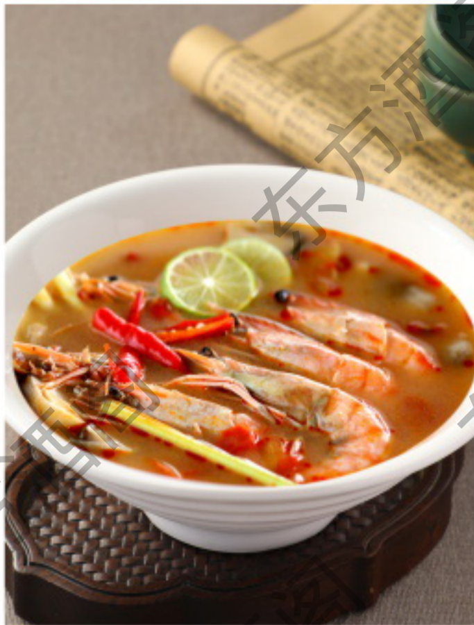
B085 泰式东阴功 Суп Том Ям Рубль 680