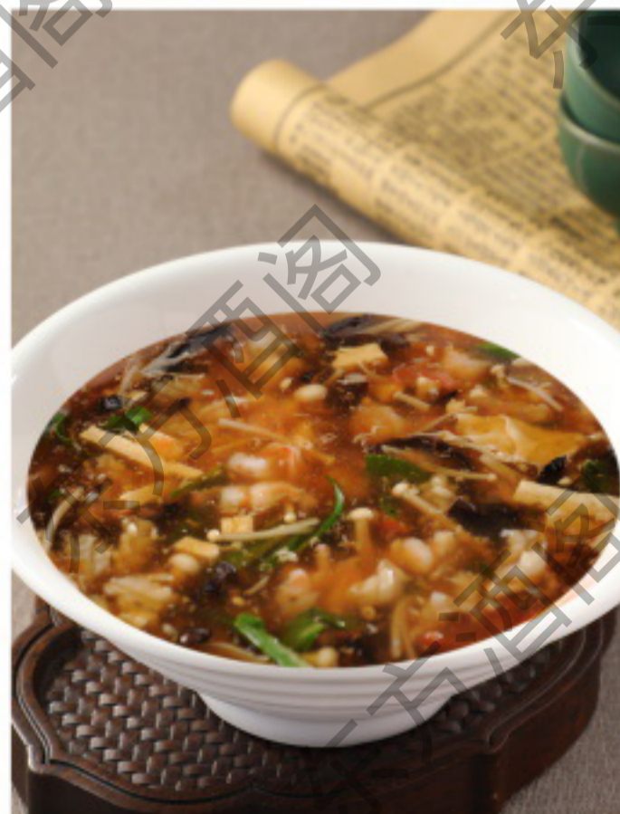
B088 三鲜酸辣汤 Кисло-острый суп из морепродуктов Рубль 1180