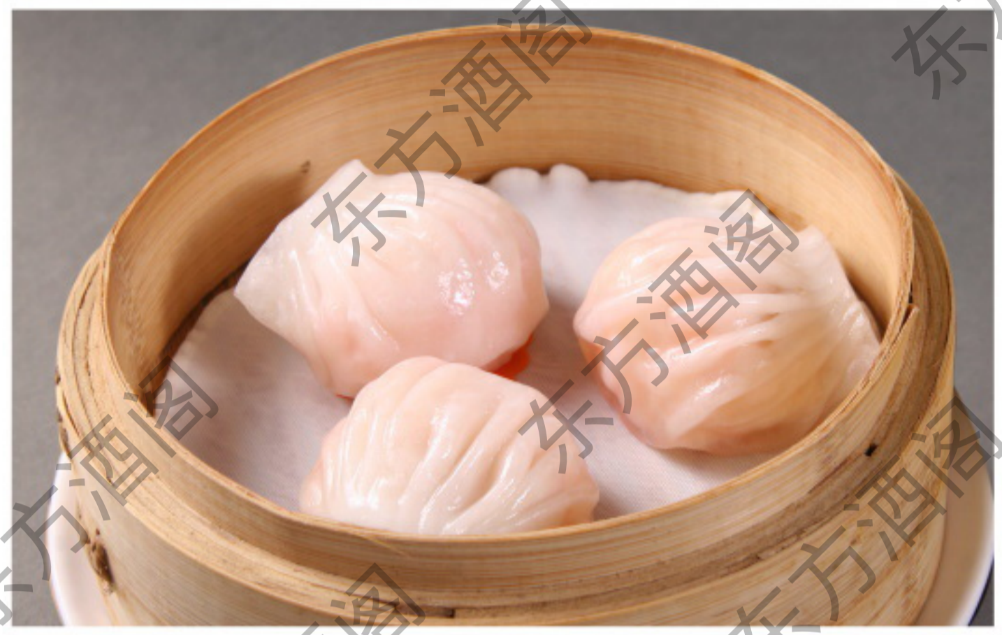
B119 水晶虾饺 Sheng Noodles с начинкой из креветок, приготовленных на пару Рубль 1880