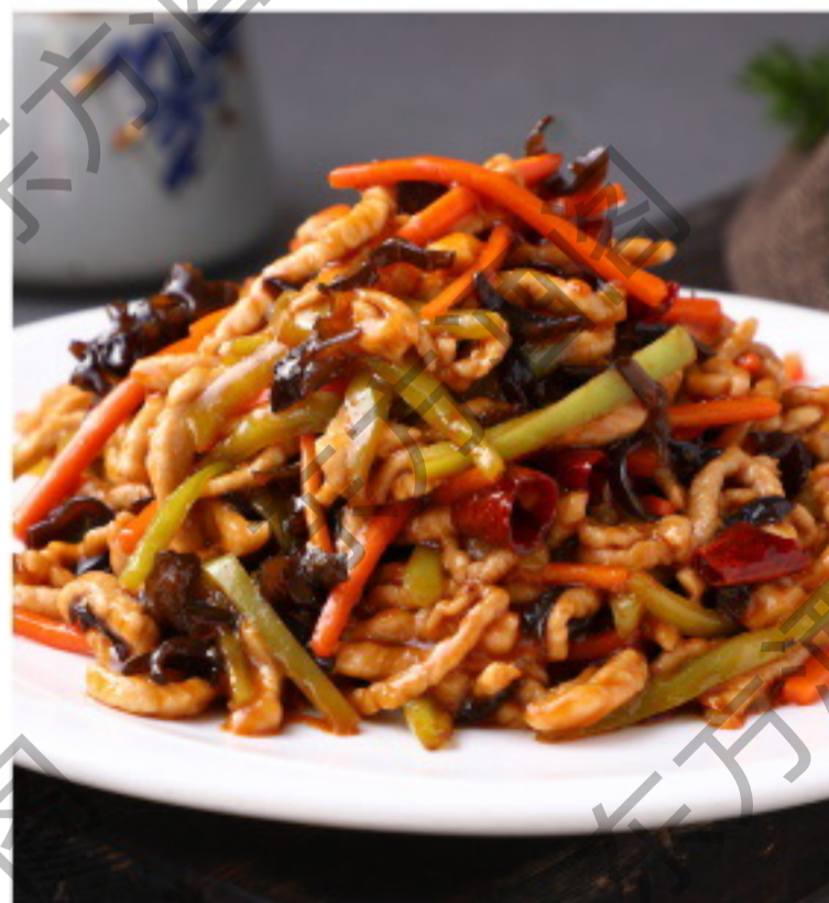
B038 鱼香肉丝 Жаренная свинина с овощами и острым соусом Рубль 1180