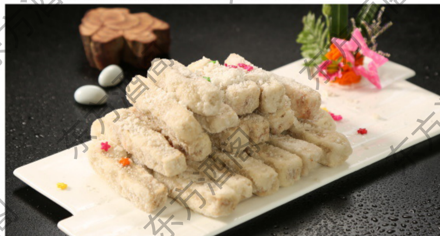
B090 返沙香芋 Жаренный таро в сахаре Рубль 1580