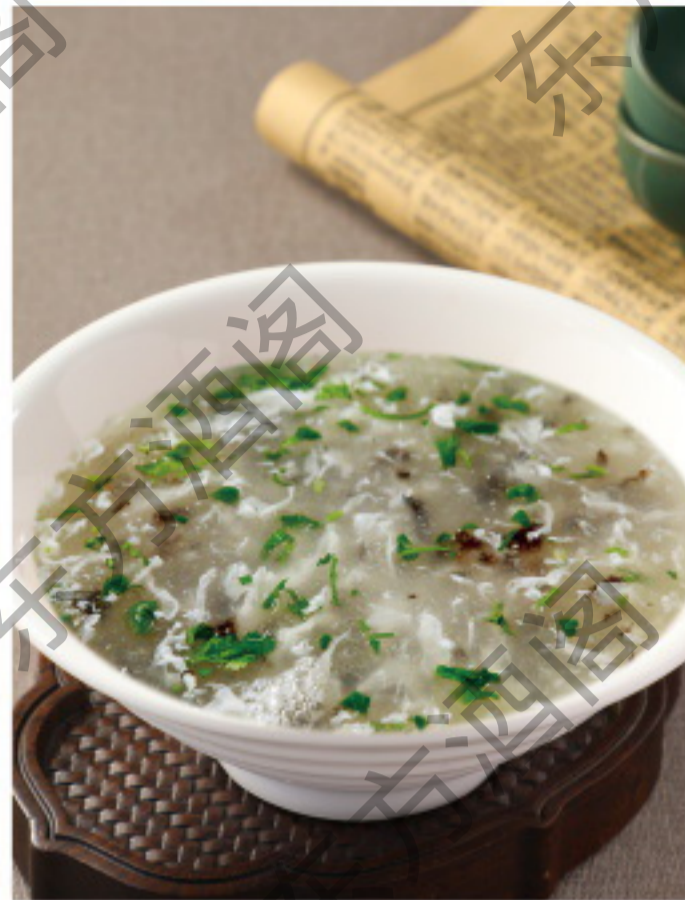
B086 西湖牛肉羹 Суп из говядины с тофу Рубль 1080