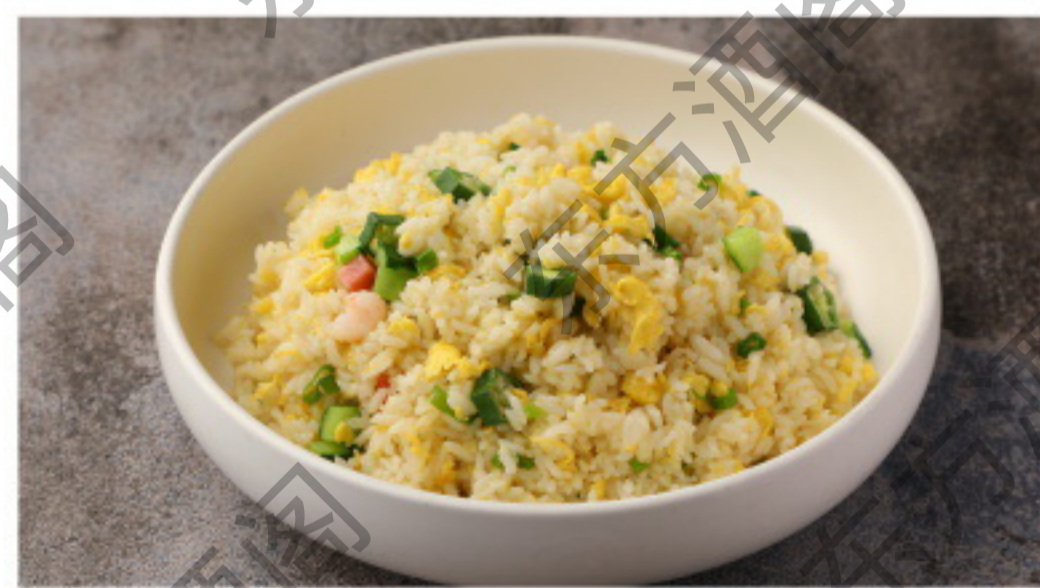
B120 扬州炒饭 Жареный рис по-кантонски (Ветчина, креветка, зелёный горошек, яйцо, морковь) Рубль 780