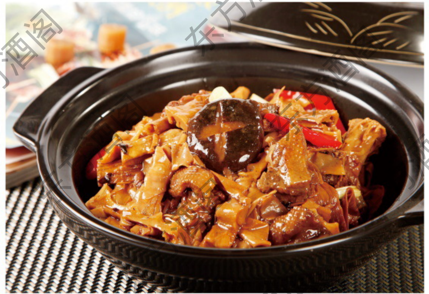
B066 笋干老鸭煲 Тушёная утка с бамбуком Рубль 2180