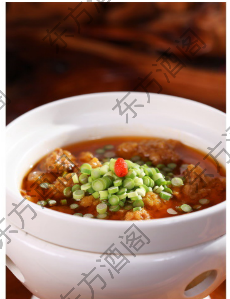
B067 川香酥肉煲 Тушёная свинина в остром соусе Рубль 1280 香酥、嫩滑、爽口、肥而不腻