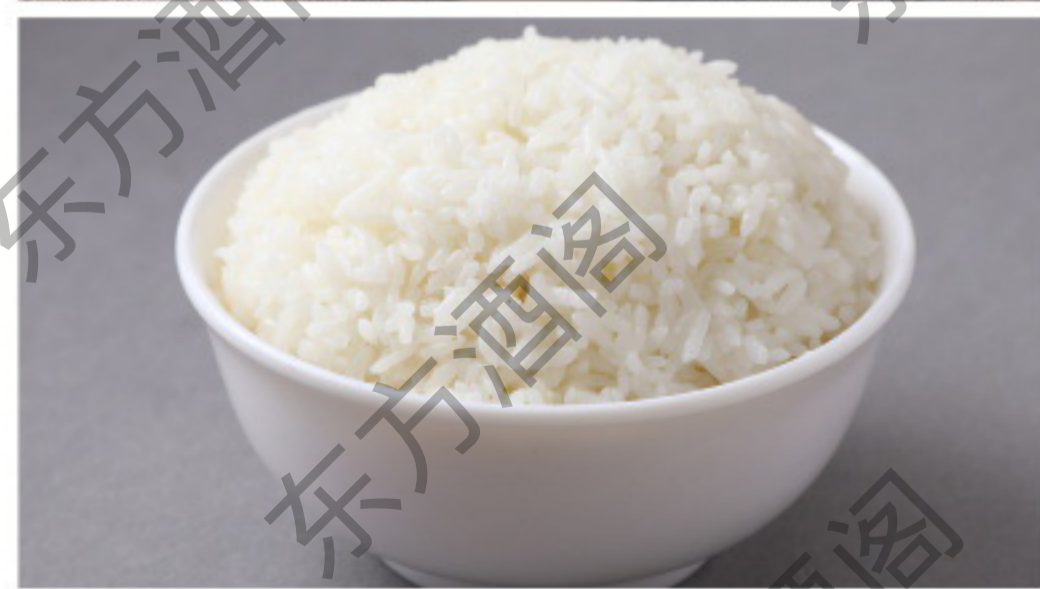
B121 米饭 рис на пару Рубль 100