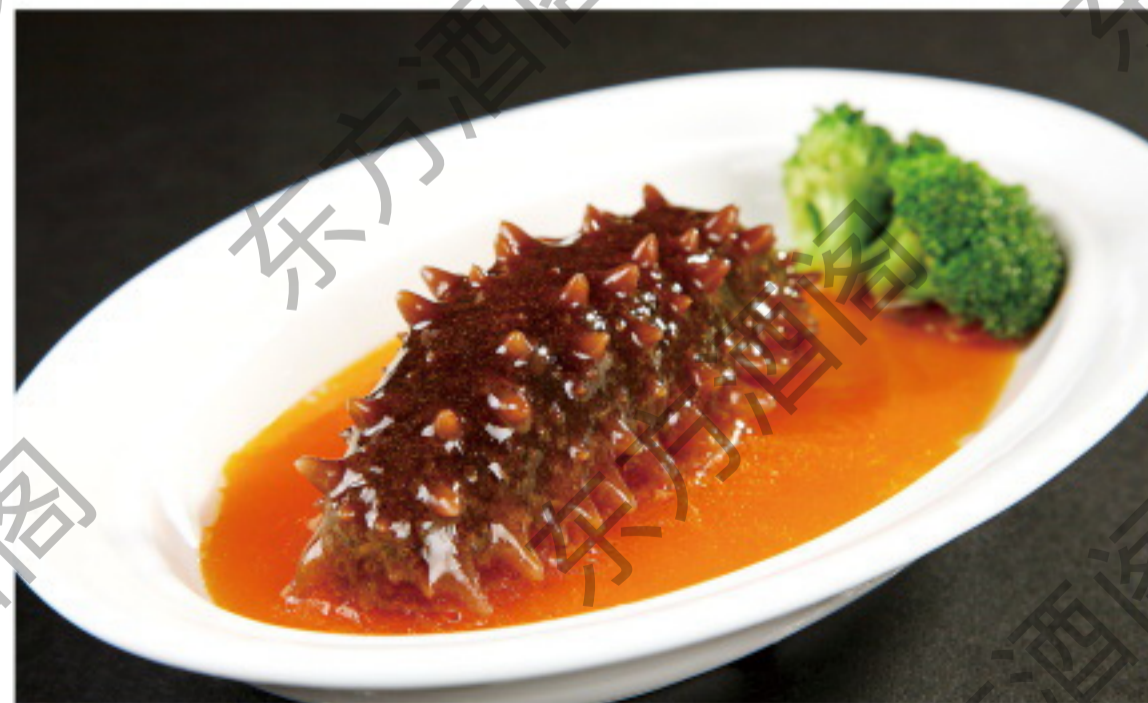
B002 鲍汁扣兰花辽参 Трепанг с брокколи в соусе из морских ушек - 1 шт. Рубль 1880