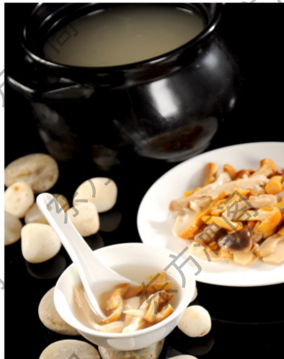
8083 滋补野山菌汤 Суп из ассорти диких грибов Рубль 1380