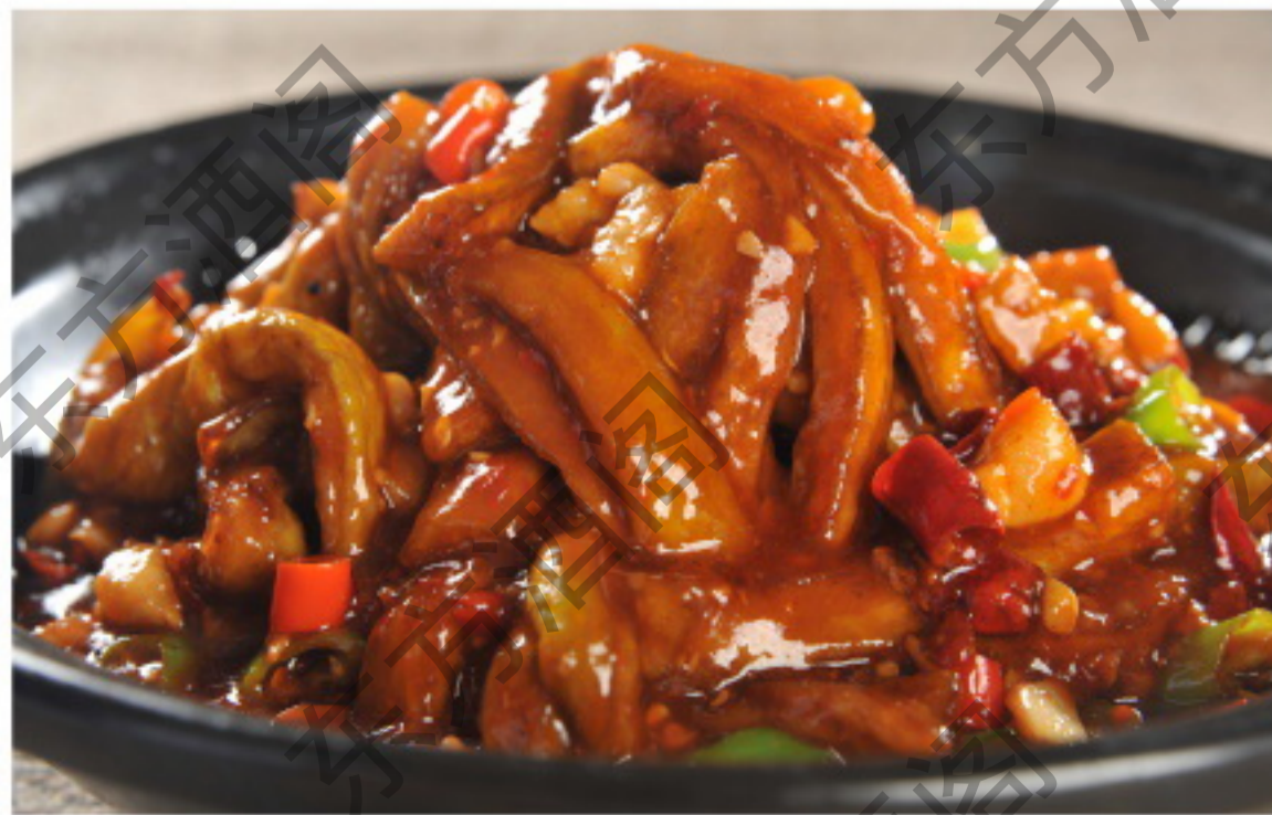
B065 鱼香茄子煲 Тушёные баклажаны в кисло-сладком остром соусе Рубль 1180