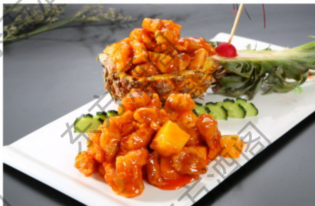
B034 菠萝咕嚕肉 Апельсиновая свинина в кисло-сладком соусе Рубль 1180