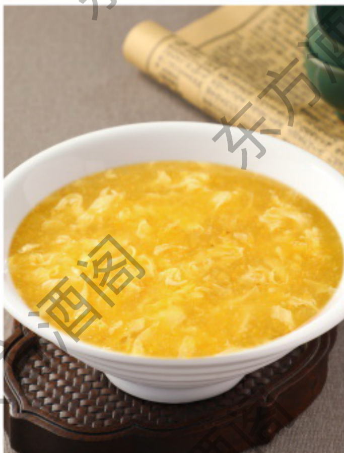
B087 蛋花玉米羹 Сладкий суп из кукурузы с яйцом Рубль 980