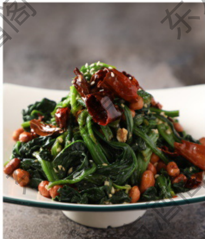
A017 果仁菠菜 Шпинат с орехами Рубль 1180