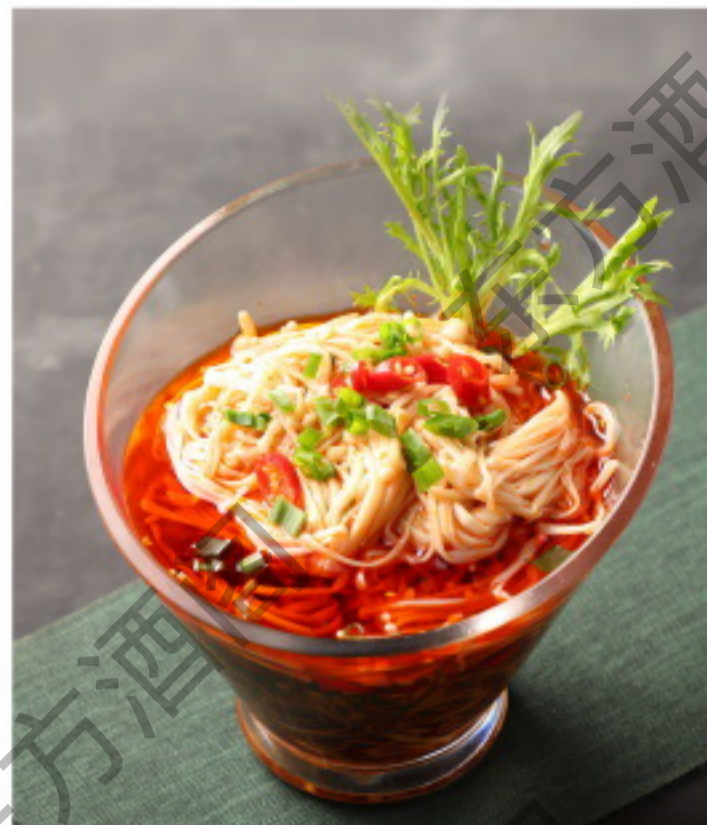
A016 捞汁金针菇 Энокки в остром соусе Рубль 1080