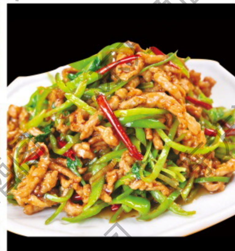
B039 香辣肉丝 Жаренная свинина с кинзой и острым перцем Рубль 1180