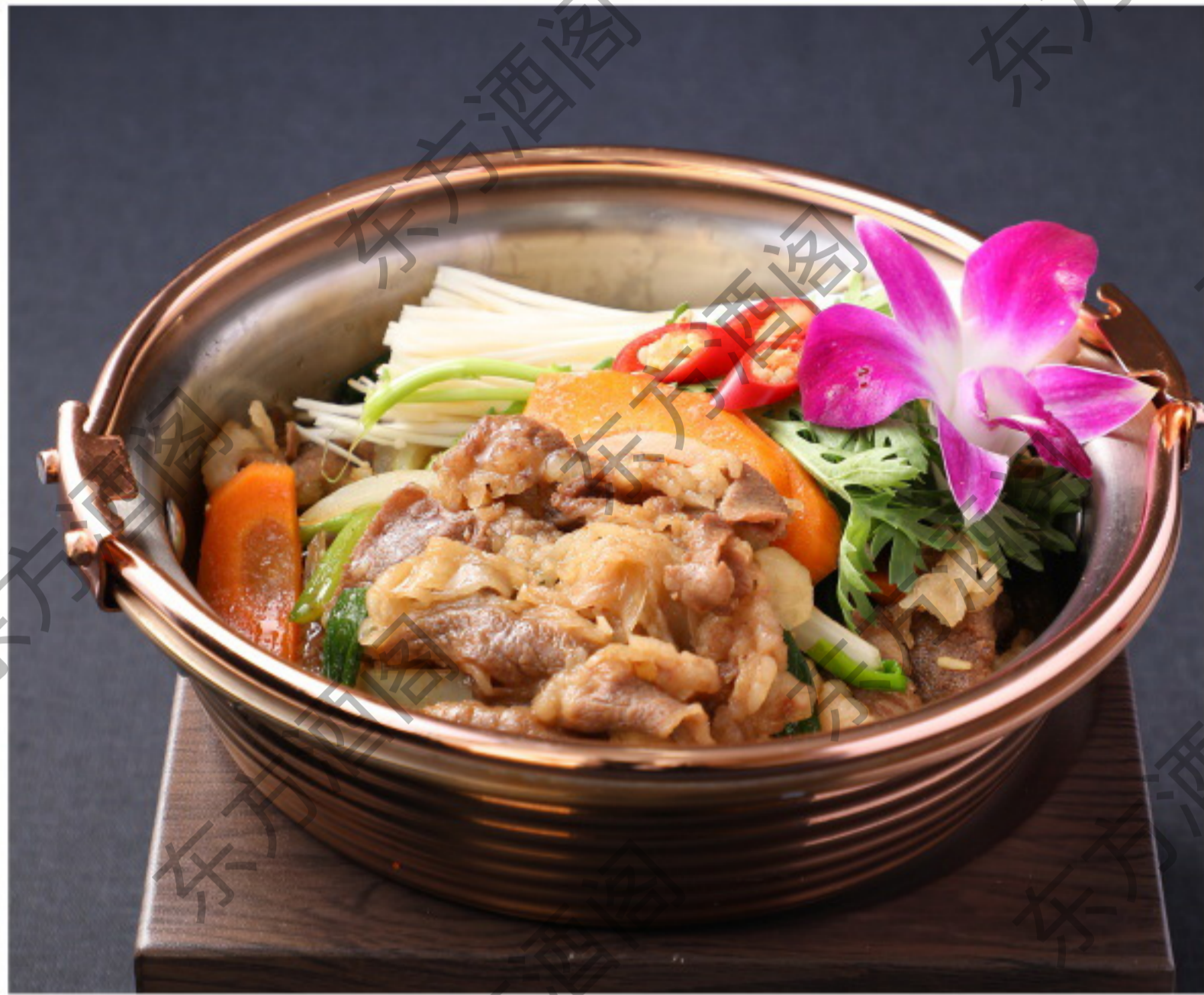
肥牛肥而不腻 肉质细嫩鲜美