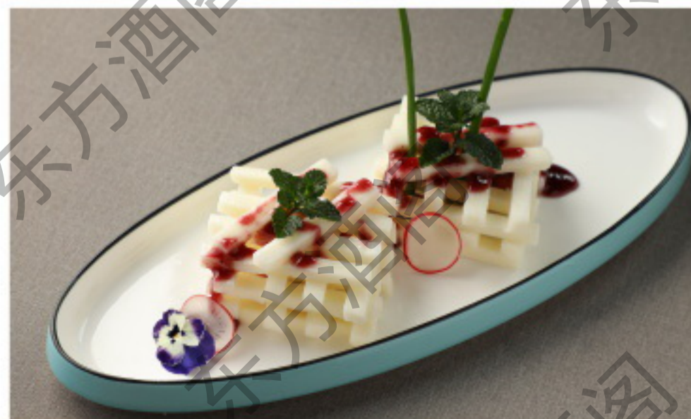
A019 蓝莓山药 Ямс в черничном соусе Рубль 1580