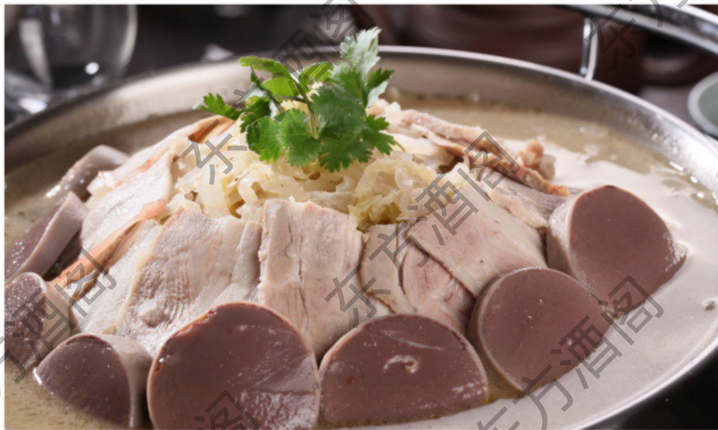
8081 银锅川白肉血肠 Котелок со свиной и квашеной капустой и кровью Рубль 1680