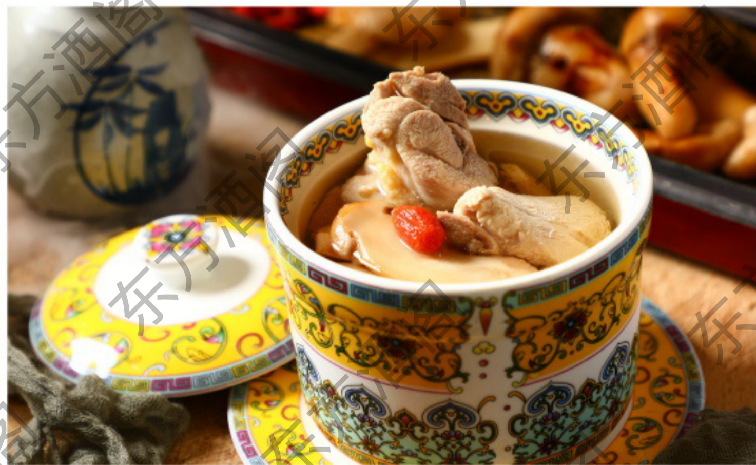
8084 滋补松茸老鸡汤 Суп из грибов мацутаке и домашней курицы Рубль 2580